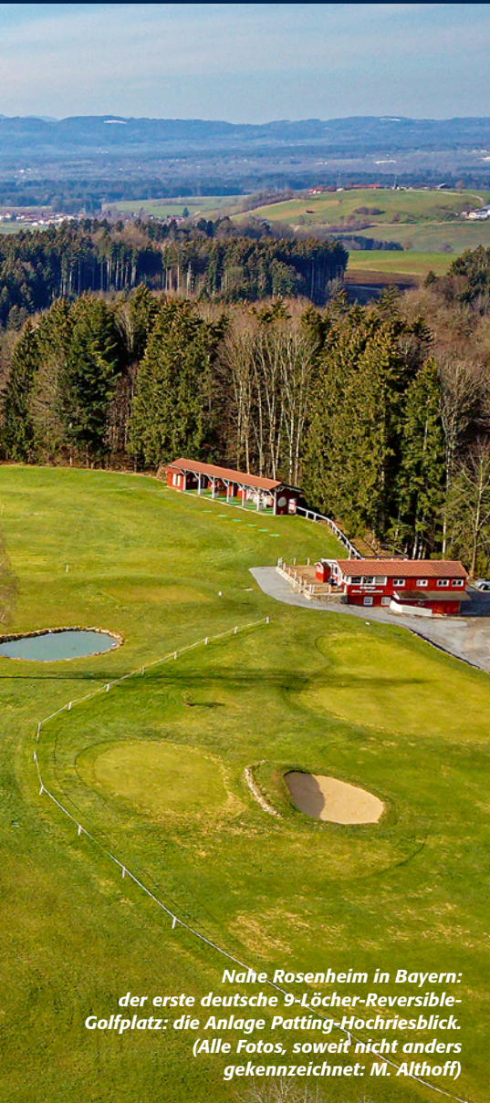
Nahe Rosenheim in Bayern: der erste deutsche 9-Löcher-Reversible- Golfplatz: die Anlage Patting-Hochriesblick.

Blick auf das Konzept des reversiblen Golfplatzes, also des in zwei Spielrichtungen nutzbaren Platzes. Dabei wird schnell deutlich, dass „Reversible Course“ bzw. „reversibler Platz“ nicht einfach bedeutet, die exakt identischen Bahnen in umgekehrter Richtung zu spielen. Vielmehr bedeutet es, die Grüns so zu gestalten, dass sie aus zwei Spielrichtungen genutzt werden können und auch Hindernisse wie Bunker oder Wasser stets in beiden Richtungen funktionieren sollen. Meist endet dies in einem unterschiedlichen Routing für die entgegengesetzte Spielrichtung, so dass ein Par 3 in der einen Spielrichtung durchaus zum Par 4 oder Par 5 in der umgekehrten Richtung werden kann. Betrachtet man die weltweite Golfzene, sind Reversible Courses weiterhin selten. Der neu gestaltete Bobby Jones Golf Course in Atlanta, USA, gehört zu diesem Typ Golfanlagen (siehe golffanager 1/23). Der renommierte Architekt Tom Doak konzipierte für Forest Dunes in Michigan gar einen 18-Löcher Reversible Course: The Loop. In Kontinentaleuropa war The Links Valley im niederländischen Ermelo (nicht zu verwechseln mit Golf Valley in Bayern) der erste reversible Golfplatz, seit 2019 können Golfer in Deutschland nahe des Chiemsees den reversiblen Platz der Golfanlage Patting nutzen