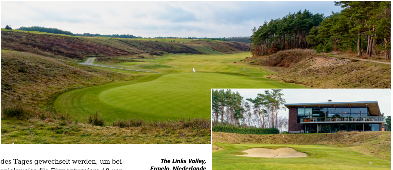
The Links Valley, Ermelo, Niederlande