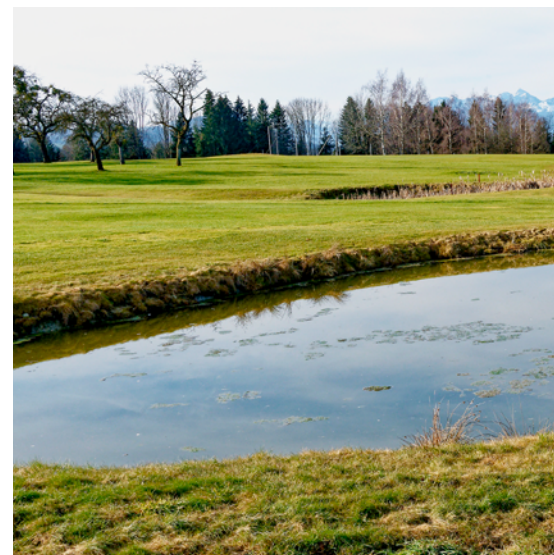
Golfanlage Patting-Hochriesblick, ...