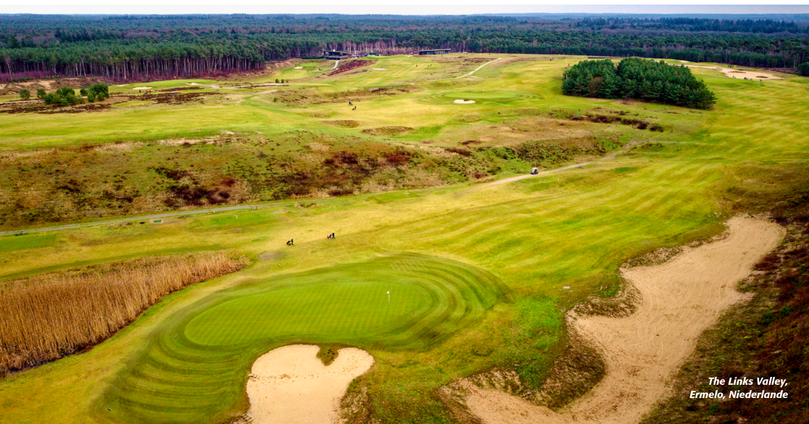
The Links Valley, Ermelo, Niederlande