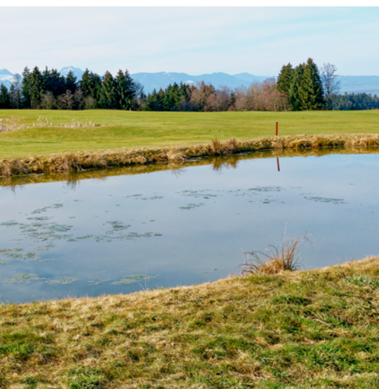
... Riedering bei Rosenheim